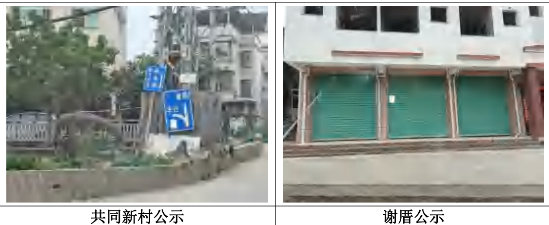
图 2-2 首次公示现场照片