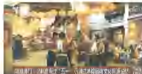
大陸“五一”假期旅遊熱，引發島內關注。

【本報台北10日電】大陸“五一”假期旅遊熱引發台灣島內關注，許多台灣遊客紛紛表示，希望當局能早日開放陸客赴台旅遊，以促進兩岸旅遊交流。