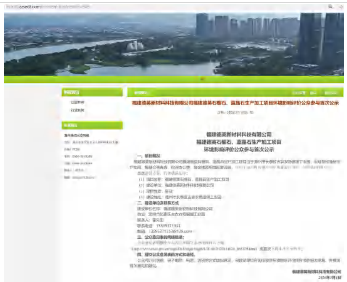
图 2-1 首次网上公示截图