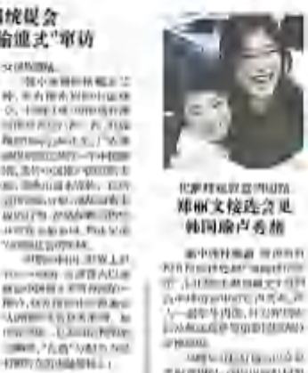
非洲發展會議代表在開羅視會，譴責賴清德日前訪問台灣一事。

【本報台北10日電】非洲發展會議10日在開羅舉行，與會國代表對台灣總統府副秘書長賴清德日前訪問台灣一事表示強烈譴責，認為這是嚴重違反國際法和國際關係基本準則的“偷渡式”窜访。